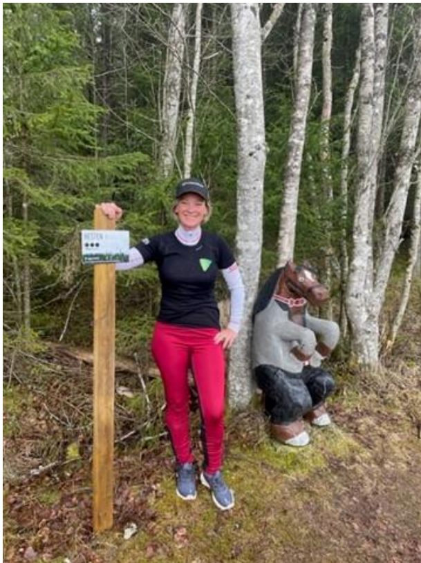
Hesten var en del av Ti på Topp i Steinkjer i 2022