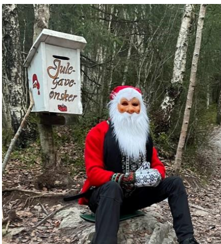
Nissen på plass i Trollstien for å ta i mot ønskelister.

Sammen med Sparebank 1 SMN arrangerte Ofteåsens venner julestoltenning siste lørdag før advent. Det ble publisert i media og nettsider og totalt var det rundt 200 som deltok på julestoltenning. Thomas Brøndbo sto for underholdning og det ble servert gløgg og pepperkjeks. I tillegg stilte SMN med uttrekkspremie. Ved nissen i trollstien hadde vi den «ordentlige» Nissen på besøk som tok i mot ønskeliste fra barna. Arrangementet hadde omtale i Trønder-Avisa og Steinkjer-Avisa