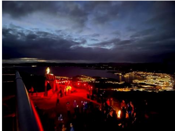
Godt oppmøte under Julestoltenningen

Styret ønsker å gi en stor takk til alle som stiller opp som frivillig!